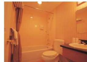
洋式バス&シャワールーム(2F)