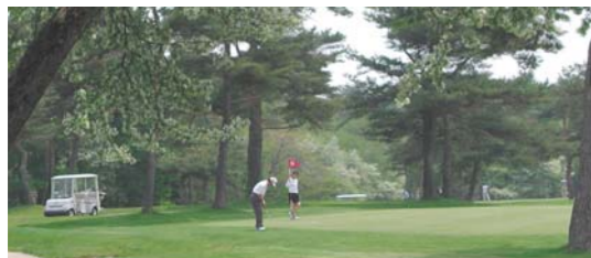
ゴルフ(軽井沢72ゴルフ)