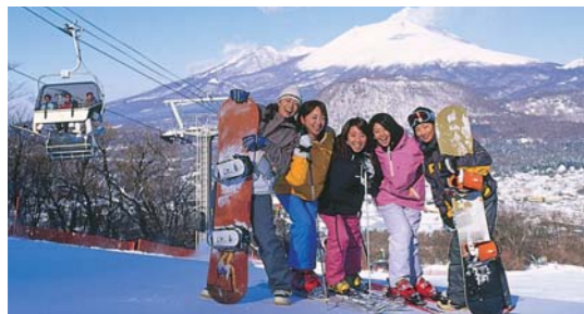
軽井沢プリンスホテルスキー場