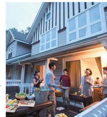
バーベキューも楽しめるウッドデッキ

キッチンで好みのものを作るもよし、洒落たレストランでディナーを楽しむもよし。和食、洋食、中華、イタリア料理等とバラエティに富んだおすすめのお店がたくさんあります。また、スーパーやコンビニエンスストアも車で3分~10分で行けますのでとても便利です。