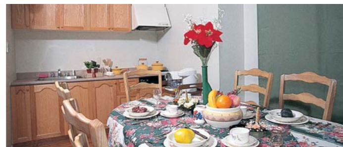
ダイニングキッチンご利用のイメージ

カナダ直輸入の断熱性に優れた建物ですから、真冬でも暖かく過ごせます。滞在に必要なキッチン、什器、備品などの設備や家具もそろっておりますので、オールシーズン、快適な別荘ライフをご体験いただけます。