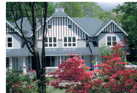
レンゲツツジの咲く5月

軽井沢は、古くから著名な作家や詩人、それに数多くの文化人などに愛され続けてきた、日本を代表する国際的リゾートです。