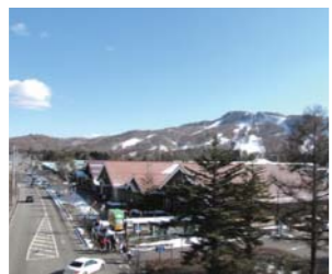
アウトレットでショッピング