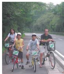
ファミリーでサイクリング