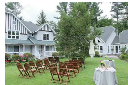
ウェディングご利用のイメージ