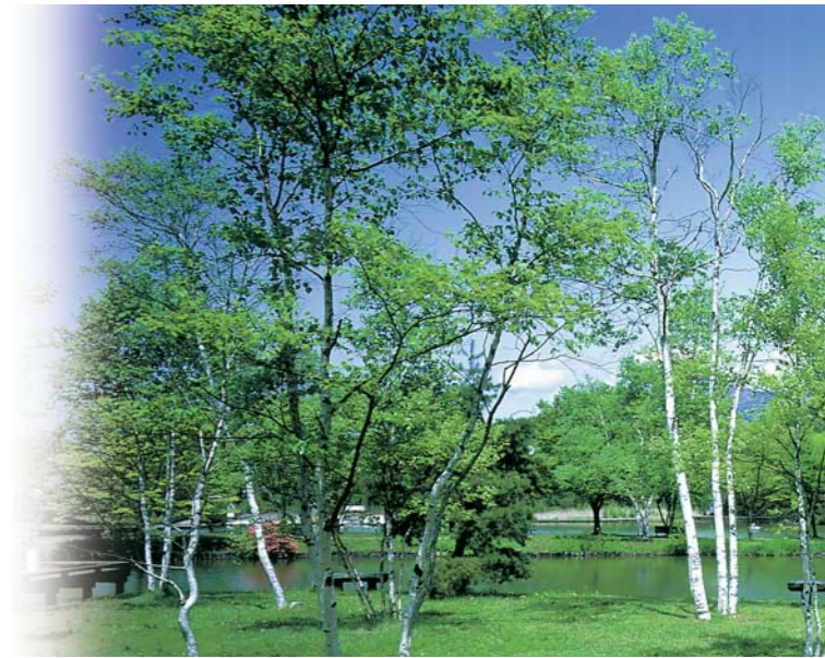
新緑の軽井沢(イメージ)