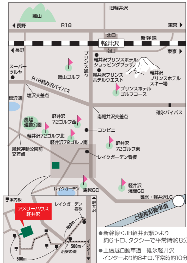
アメリカハウス軽井沢案内図