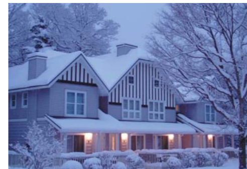
宿泊棟B(4棟 最大24名様)